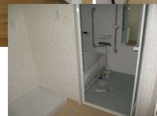
※間取図: 反転する場合があります。